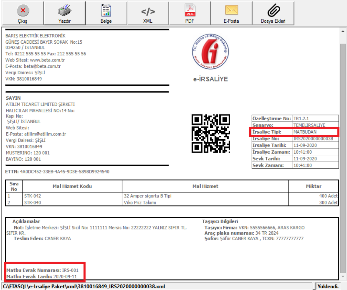
Ekran 4 : E-İrsaliye Görüntüsü