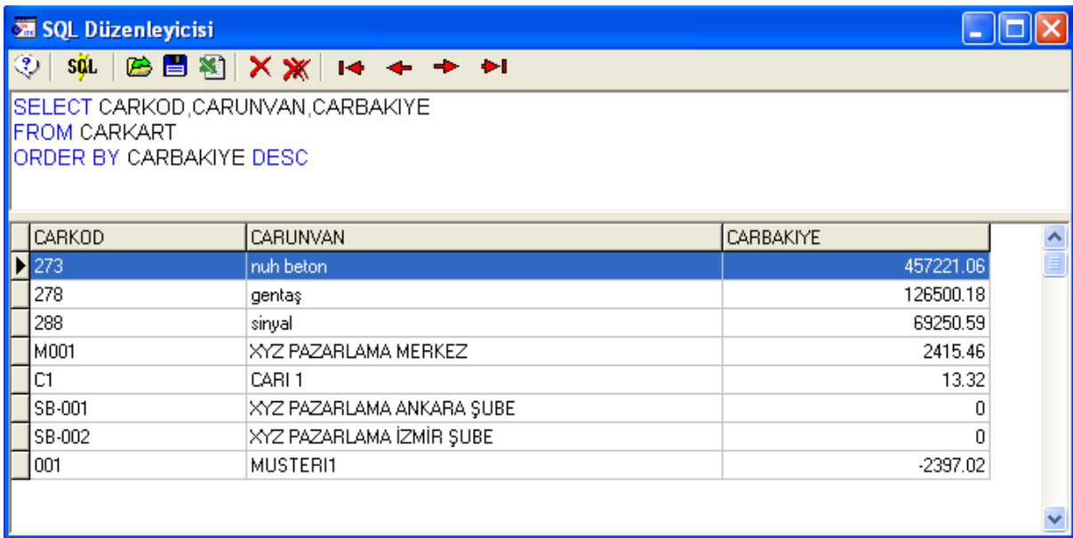
Ekran 3: SQL Düzenleyici

Örnek sorgular, SQL Düzenleyici ekranına yazılır ve F5-Sorgu Çalıştır butonuna basılır. Bu işlem sonucunda çıkan veriler, Ekran 3'te görüldüğü gibi ekranın alt bölümünde yer alır.